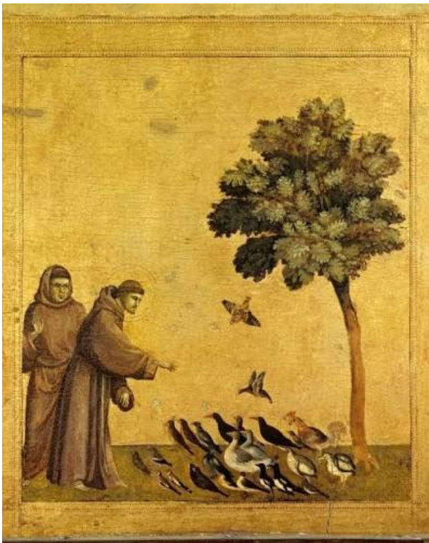
Sint-Franciscus predikt voor de vogels, Giotto (1299), Louvre, Parijs

Zijn betoog oprecht, zijn toon vederlicht.