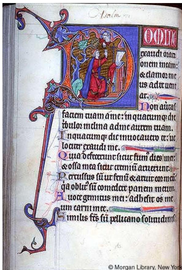
Psalm 102, Engels Psalterium uit de late 13 de eeuw, The Morgan Library, New York. De omstreden pelikaan staat op de laatste regel.

Ik ben als een uil in de woestijn,/ een steenuil in een verlaten bouwval,/ slaap ken ik niet, ik ben eenzaam / als een vogel op het dak.