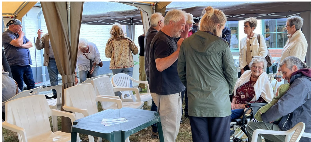
Bij de reünie van de oud-leerlingen vorig jaar

Voor het vierde jaar op rij is er een 'zomerterras' in de tuin van het 'Protestants museum 'De Geuzenhoek''. Op zondagnamiddag is iedereen van harte welkom voor een moment van weerzien, kennismaking met de buurt, de Geuzenhoek en het museum, onder het genot van een drankje, een koekje, wat muziek, ..... Op enkele zondagen zijn er ook leuke en interessante activiteiten in de aanbieding.