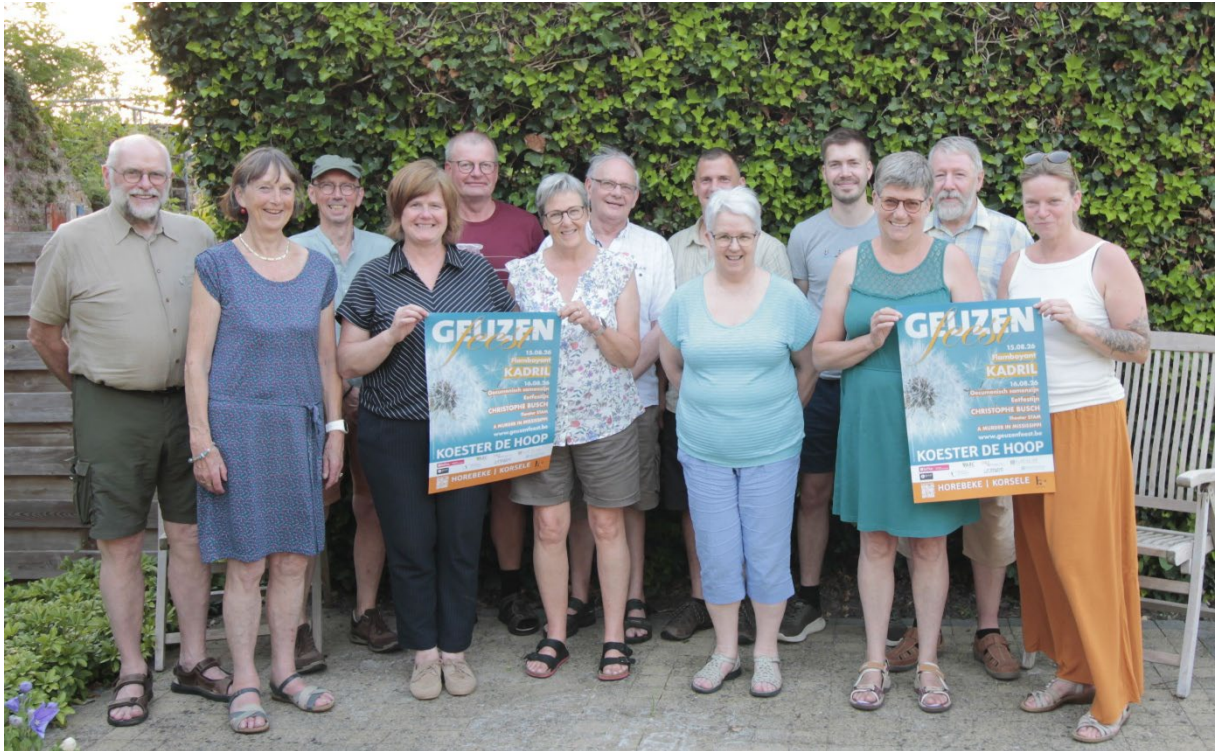
De trekkersgroep. Er ontbreken nogal wat leden op de foto.

Lukt het niet om zelf mee te werken, maar je wil het feest op een andere manier steunen, dan is elke gift meer dan welkom. Zo kunnen we het feest betaalbaar houden, en kunnen we tegelijkertijd een mooi bedrag ten voordele van onze goede doelen realiseren. Giften zijn welkom op de rekening van De Geuzenhoek vzw BE75 0014 0572 9151.