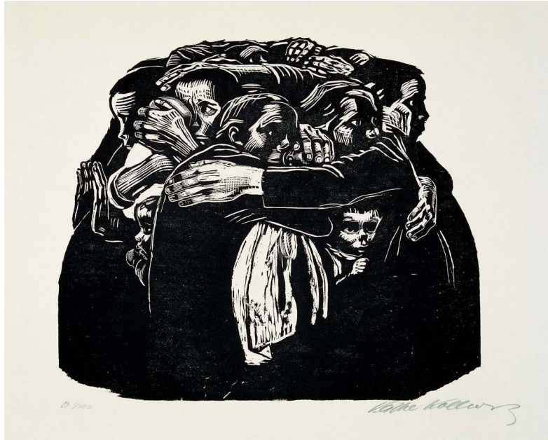
De beschermende moederhanden van Käthe Kollwitz

Wie het evangelie van Lukas openslaat, zou denken dat het kind dat aangekondigd wordt inderdaad de lang verwachte leider is die het joodse volk zal verlossen van de Romeinse overheersing. Er is in de eerste hoofdstukken regelmatig sprake van een koning en die passages tonen aan dat Lukas goed op de hoogte was van de publieke opinie van zijn tijd. Maar de verwachtingen worden snel de kop ingedrukt wanneer Jezus zijn blijde boodschap begint te verkondigen. Dat die boodschap niet uitsluitend bedoeld is voor het joodse volk wordt duidelijk bij zijn eerste optreden in zijn geboortestad Nazareth (Lukas, 4: 14-30). In de synagoge verwijst hij naar de profeet Elia die door een weduwe uit Sidon in Libanon werd opgevangen (dus niet door een joodse weduwe) en daarna herinnert hij de aanwezigen aan de profeet Elisa die een Syrische man genaamd Naäman geneest (en dus geen Jood). De inwoners van Nazareth worden woedend want eigen volk eerst is van alle tijden. Ze willen Jezus lynchen maar die gaat onverstoord zijn eigen weg. Als Jezus vandaag zou leven, zou hij geen onderscheid maken tussen Israëli's, Syriërs, Libanezen of Palestijnen. Hij zou geen enkel onderscheid maken tussen mensen want niet de afkomst is van belang maar hoe je denkt, voelt en handelt.