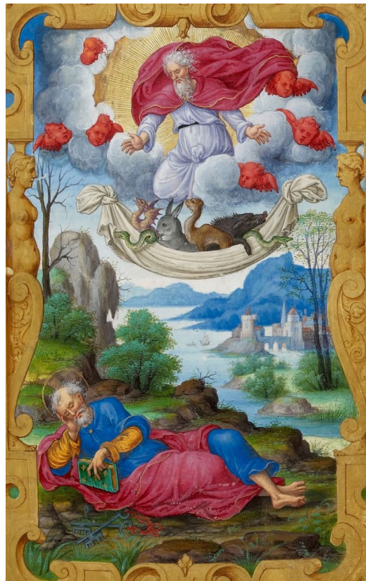
Het visioen van Petrus in Handelingen 10. Alle dieren zitten samen omdat de joodse spijswetten niet langer van toepassing zijn. Frans miniatuur uit 1545.

Maar ook bij de apostel Petrus, die de blijde boodschap lange tijd niet had begrepen, vallen al snel de oogkleppen weg. In het opmerkelijke tiende hoofdstuk zijn we getuige van een mentale dijkbreuk. Eerst ziet Petrus in een visioen dat de joodse spijswetten achterhaald zijn en daarna wacht hem nog een grotere verrassing bij zijn ontmoeting met de Romeinse centurio Cornelius. Petrus is zeer verbaasd door de hartelijke ontvangst en de openheid waarmee deze gehate Romein naar hem luistert. Deze buitenlander brengt hem een waardevolle les bij: “Nu begrijp ik pas goed dat God geen onderscheid maakt tussen mensen, maar dat hij zich het lot aantrekt van iedereen, uit welk volk dan ook, die ontzag voor hem heeft en rechtvaardig handelt.” (Handelingen, 10:34-35)