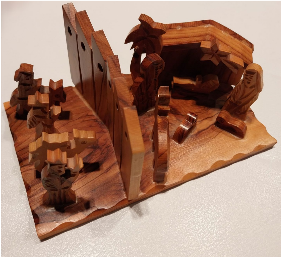
Christendom in het huidige Israël: de drie koningen geraken niet in Bethlehem door de afscheidingsmuur.