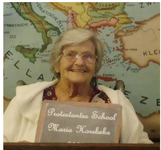
Op de schoolbank tijdens de reünie