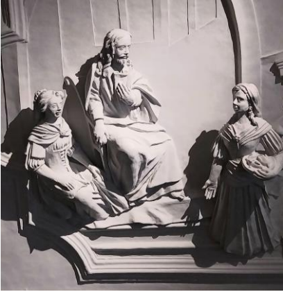
Jezus tussen Martha en Maria op het plafond van de refter van de Abdij van Park, Heverlee

Het zien van het lijden van een medemens is al voldoende om meteen te hulp te schieten. De christen rekent niet op een wederdienst, zoals de helden van Homeros. Sterker nog: de verhouding tussen gast en gastheer wordt volledig omgekeerd. Bij het laatste avondmaal wast Jezus de voeten van de leerlingen. Dat zou in de Griekse wereld ondenkbaar geweest zijn.