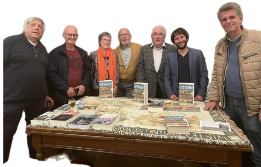
Het museumbestuur met de schrijver en inleider